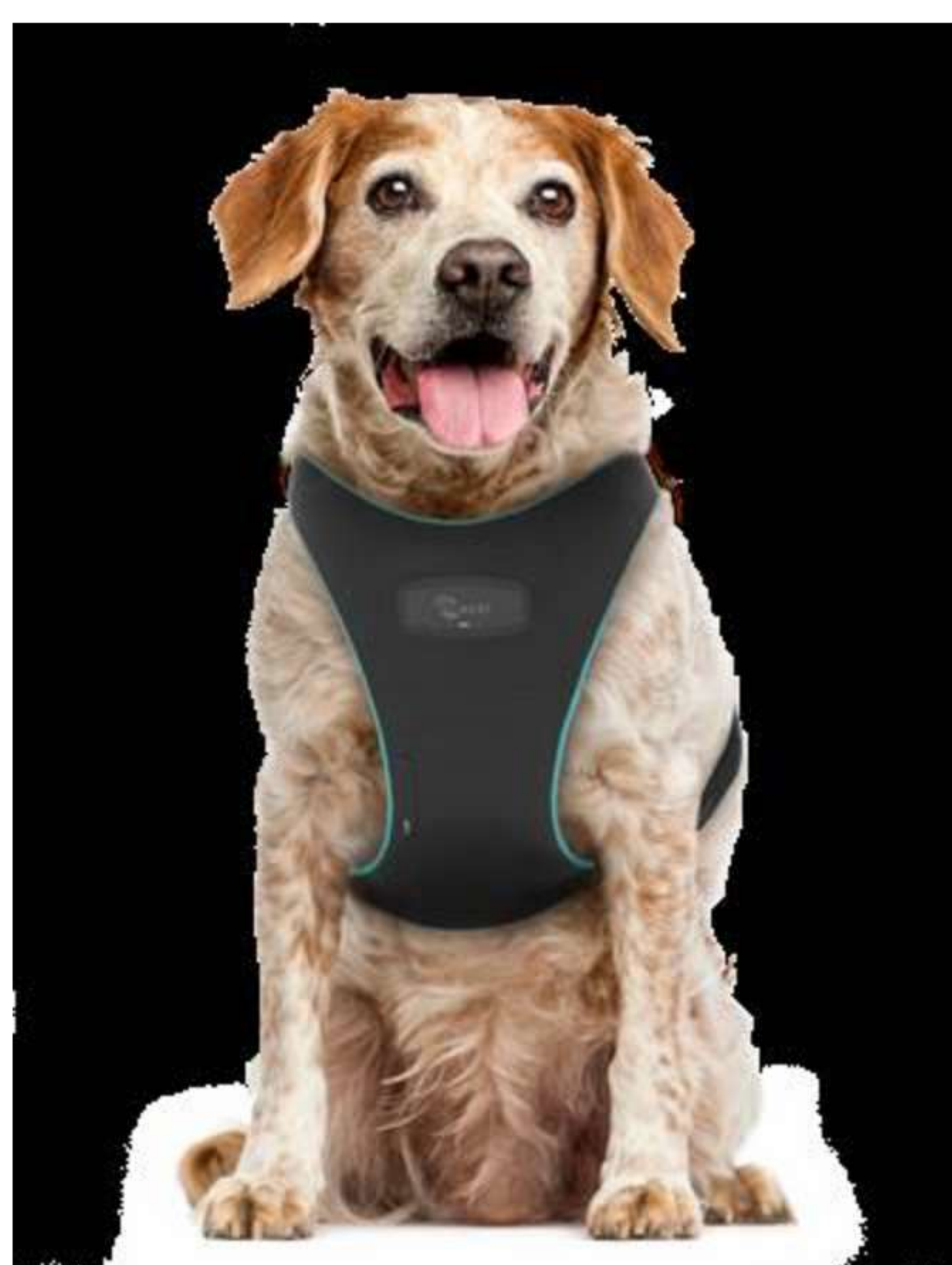
Las nuevas tecnologías también mejoran la salud de las mascotas