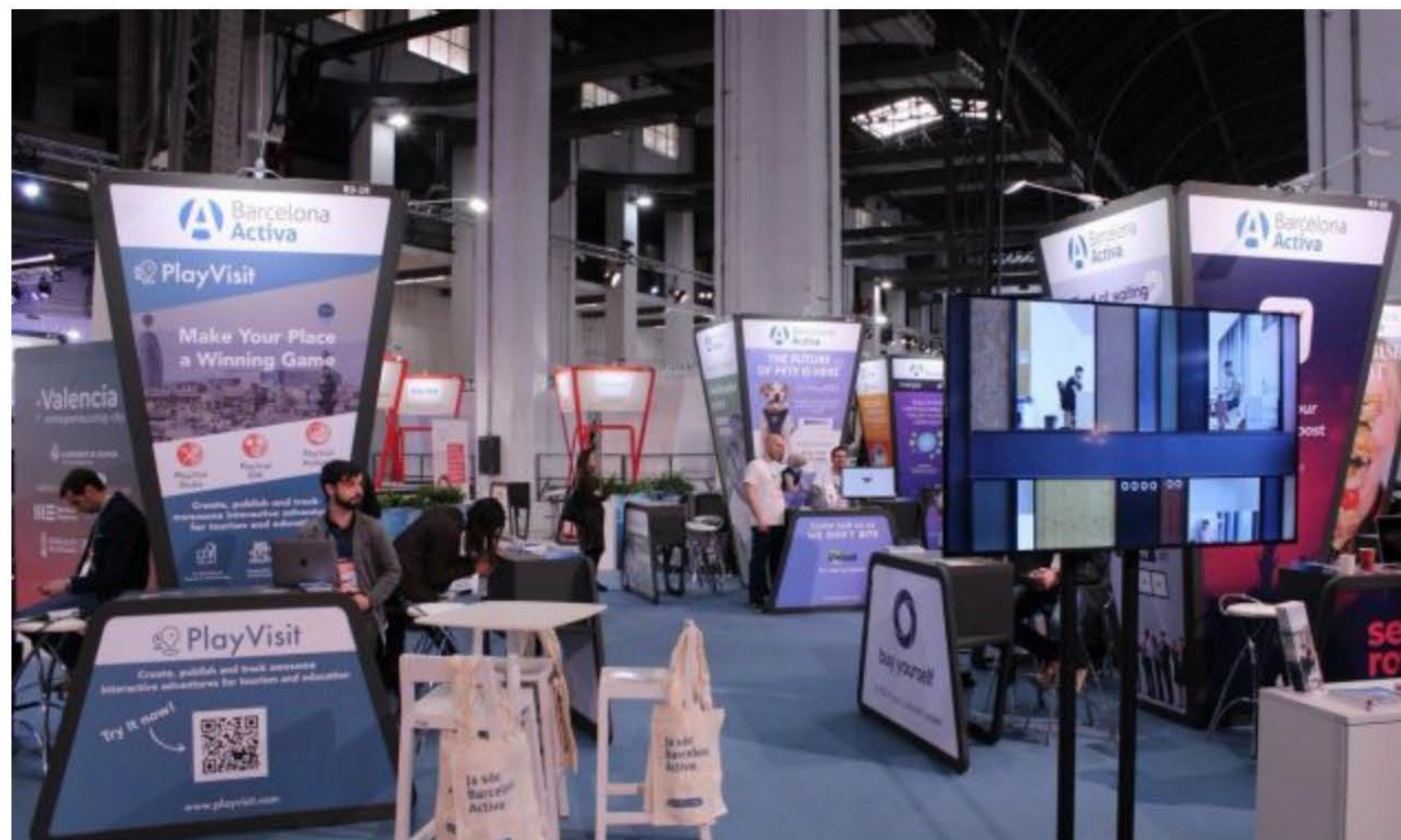
Barcelona Activa porta 20 startups barcelonines al 4YFN

Barcelona Activa i porta 20 startups de Barcelona al 4YFN d'aquest 2019 amb l'objectiu d'incentivar la seva activitat i coneixement en el mercat local i internacional. Les empreses, amb un any o poc més d'un any de vida, són de sectors tan variats com la biomedicina, la música, els jocs, la gastronomia, l'audiovisual, entre d'altres.